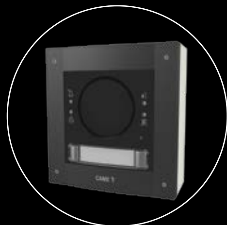
ZAMAK IK09 K09 CERTIFICIRANA ANTIVANDALSKA RAZLIČICA